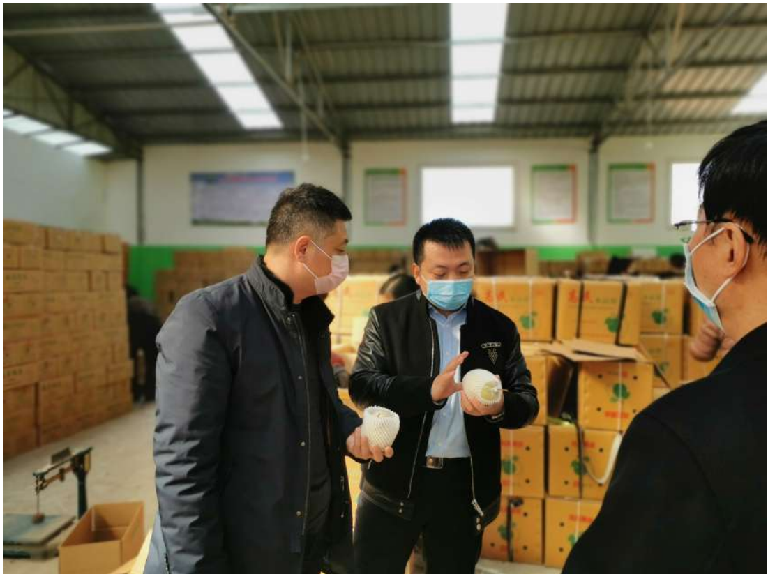
助力河北鴨梨銷售

在多方的認同和鼓勵下，本集團與魏縣繼續開展長期合作，在服務業主的同時繼續進行撫農惠民工作。