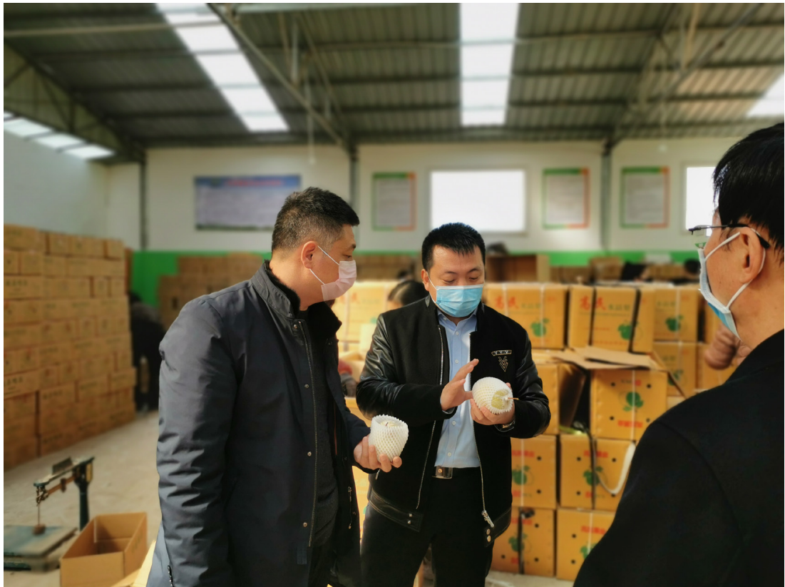
助力河北鴨梨銷售

在多方的認同和鼓勵下，本集團與魏縣繼續開展長期合作，在服務業主的同時繼續進行撫農惠民工作。